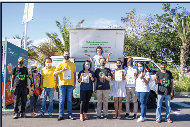
Mo Enn Consom-Akter Responsab, Mo Konsian Mo Pran Kont

Persévérance, efforts et détermination... Chez Zethical Ltd, ce n'est pas un slogan creux. Et les African SABRE Awards 2022 viennent le confirmer.