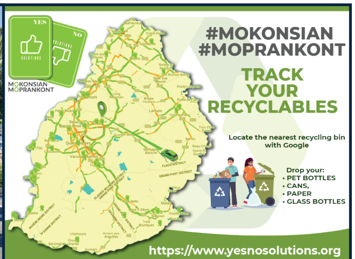
Yes No Solutions