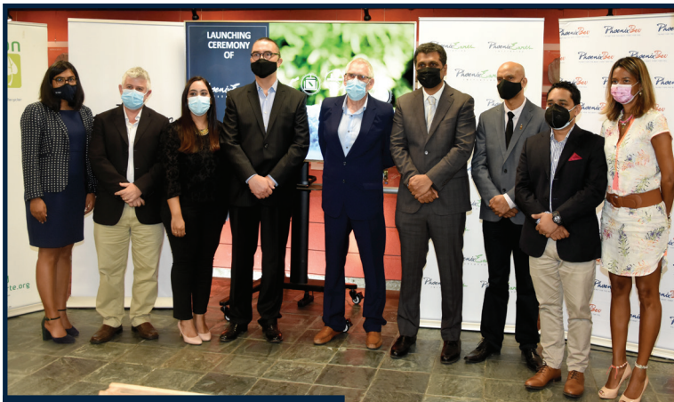
Lancement de PhoenixEarth Initiative

L'agence propulse l'île Maurice au-devant de la scène sur le continent Africain lors des African SABRE Awards 2022. Ce rendez-vous annuel fait la part belle aux travaux des agences de PR et Communication.